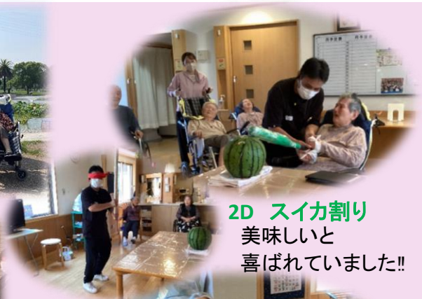
2D スイカ割り 美味しいと 喜ばれていました!!