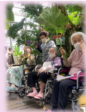
2C 外出 咲くやこの花館 に行ってきました