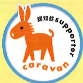
認知症サポーターキャラバン