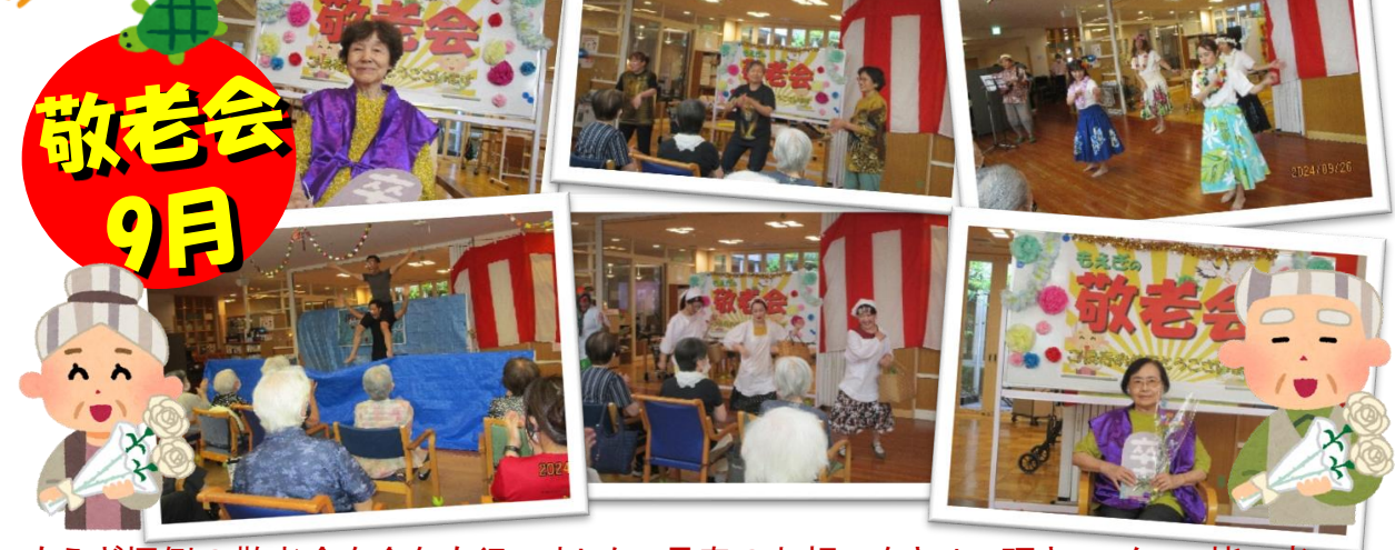
もえぎ恒例の敬老会を今年も行いました。長寿のお祝いをさせて頂き、スタッフ皆で考えた出し物を楽しんで頂きました。スタッフみんな練習、頑張りましたよ～！！(*´艸`)