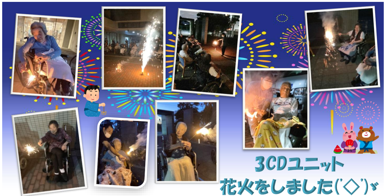
3CDユニット 花火をしました(◇)♪