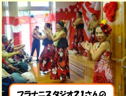
フラニスタジオ21さんの フラダンス！癒される～♪