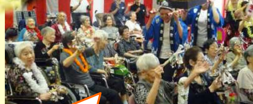
お神輿も出てきた！ ワッショイ！