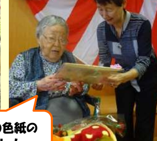
お祝いの色紙の プレゼント！