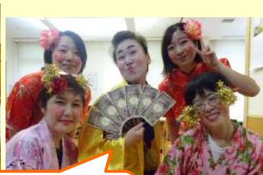
マツケンサンバ！ マツケン？バカ殿??