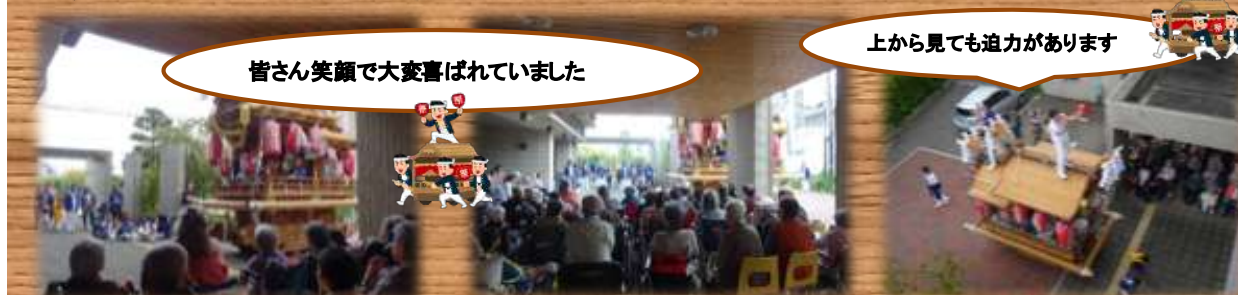
皆さん笑顔で大変喜ばれていました